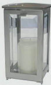
405 D / S Børstet stål med krystaller Høyde 19 cm