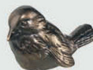
534 Bredde 11 cm