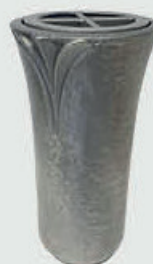
T 4341 – Alufarget bronse Høyde 19 cm, bredde 10 cm