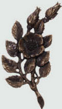
250 Høyde 24 cm, bredde 11 cm