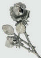
P 29 351 – Chromato Høyde 14 cm, bredde 9 cm