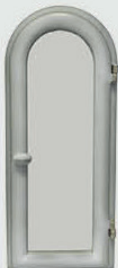
702 914 QW – Hvit matt patina Høyde 32 cm, bredde 14 cm