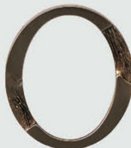
P 19 275 Høyde 15 cm, bredde 11 cm Høyde 12 cm, bredde 9 cm