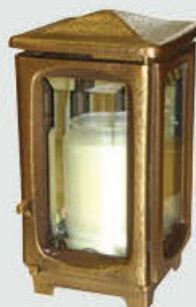
1521 F Høyde 19 cm