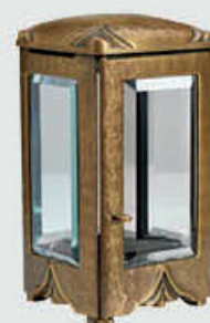
T 4340 M Høyde 20 cm, bredde 11 cm