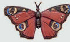
20295 Høyde 5,5 cm, bredde 9,5 cm