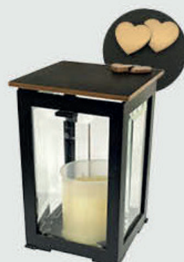
1651.CL Høyde 16 cm. Åpning halve lykten