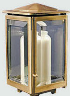
1004 – M12