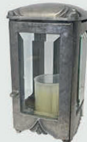
T 4340 – Alufarget bronse Høyde 20 cm, bredde 11 cm