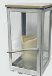
5403 QW - Hvit matt patina Høyde 22 cm