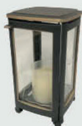
454503 QG - Brun matt patina Høyde 17,5 cm