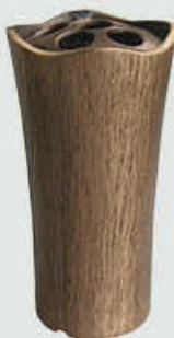
2500 Høyde 19 cm

En fuktig klut er ofte tilstrekkelig til å fjerne lett smuss, fingeravtrykk og lignende.