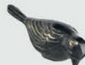
226 / Ned Bredde 9 cm