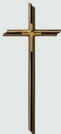
P 24 237 Høyde: 40 / *30 cm