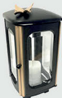
T 188-9R – Svart / Bronse Høyde 23 cm, bredde 11 cm