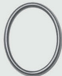
P 20 557 – Aluminium Oval / Rektangulær Høyde 12 cm, bredde 9 cm