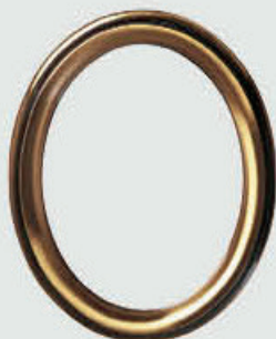
P 19 787 Høyde 15 cm, bredde 11 cm Høyde 12 cm, bredde 9 cm