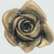
470403 Ø 5 cm