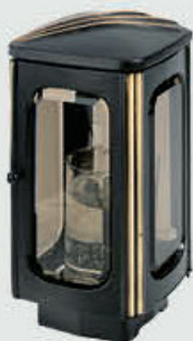
T 168.7 – Svart / Bronse Høyde 22 cm, bredde 11 cm