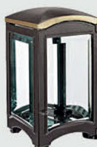
4056 VB Høyde 20 cm