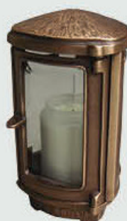
1000 F Høyde 20 cm