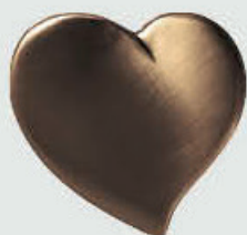
P 32 558 Høyde 8 cm, bredde 8 cm Høyde 9 cm, bredde 9 cm Høyde 10 cm, bredde 10 cm