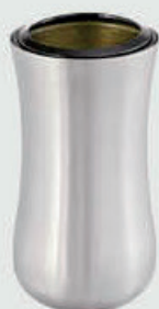
T 0800 – Børstet stål Høyde 20 cm, bredde 12 cm