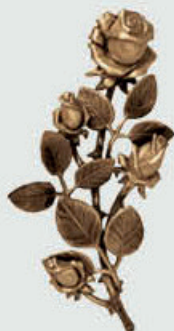
P 29 351 Høyde 22 cm, bredde 11 cm