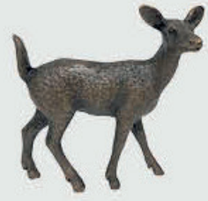
947 Hjortedyr – Bronse 8 x 8,5 x 3,5 cm