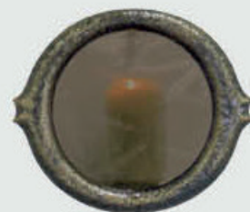
10 066 Diameter Ø 18 cm