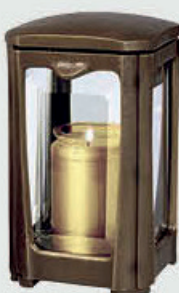
40 117 Høyde 21 cm