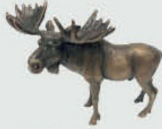
991 Elg – Bronse 12 x 9,5 x 7 cm