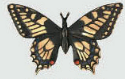
20294 / 6,5 Høyde 6,5 cm, bredde 10 cm