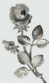
P 29 351 – Chromato Høyde 18 cm, bredde 10 cm