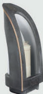
40 191 Høyde 27 cm