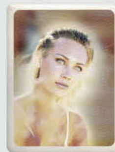
PORSELENSBILDE Rektangulær Høyde 12 cm, bredde 9 cm