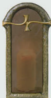
10 060 Høyde 32 cm, bredde 14 cm