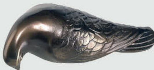
DUE 305 – 12 cm DUE 307 – 14 cm DUE 355 – 19 cm