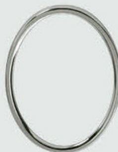
P 71 IIII – Polert Stål Oval / Rektangulær Høyde 12 cm, bredde 9 cm