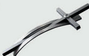
51 III sda.2 Høyde 25 cm Aluminium