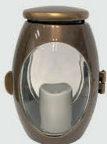
T 10 316 P 10 303