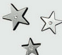
20968 Alu 2 cm – 2,5 cm – 3 cm