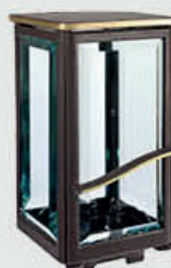
42 470 VB Høyde 22 cm