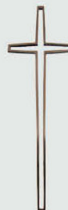
903 Høyde 35 cm