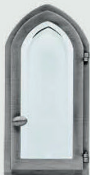
70748001 A – Aluminium Høyde 25 cm, bredde 12 cm