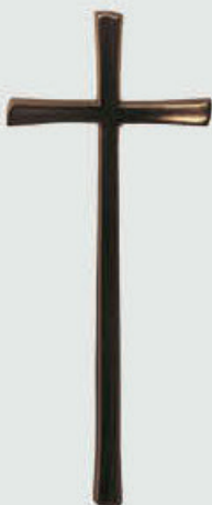
P 23 338 Høyde: 40 / *30 / 20 cm