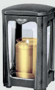
40 117 - Aluminium Høyde 21 cm