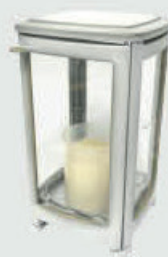
454503 QW - Hvit matt patina Høyde 17,5 cm