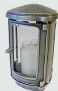
1400 F - Aluminium Høyde 20 cm