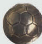
99 308 Diameter Ø 4,5 cm