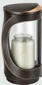
40373 Høyde 17 cm. Åpning halve lykten