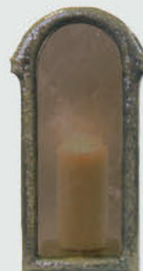
10 064 Høyde 32 cm, bredde 14 cm