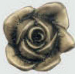
470402 Ø 4 cm