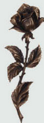
613 Høyde 30 cm, bredde 9 cm