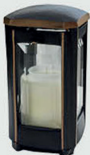
LB 105 C Høyde 19 cm