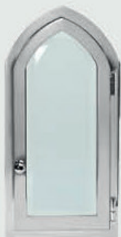
07748001 – Polert Stål Høyde 25 cm, bredde 12 cm