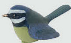
85 448 Høyde 5,5 cm Bredde 5 cm Lengde 11 cm