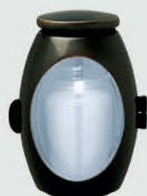
T 10 318 Classic P 10 305 Classic