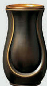
T 5987 Classic