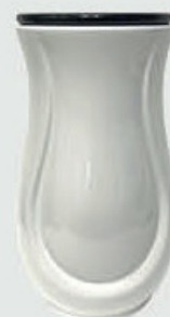
T 5985 – Hvit