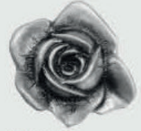
470403 – Alufarget Ø 5 cm