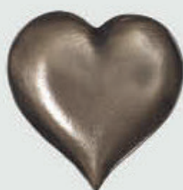
99 430 – høyde 7 cm, bredde 7,5 cm 99 430 A – høyde 4,5 cm, bredde 4,5 cm 99 431 – høyde 3 cm, bredde 3 cm Forniklet / Aluminium / Bronse