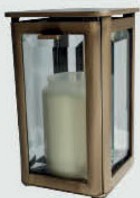
152 152 / ALU – Aluminium Høyde 17 cm