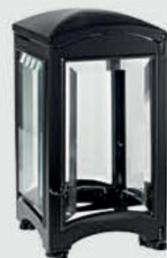
T 4056 MTB – Svart Høyde 19 cm, bredde 11 cm