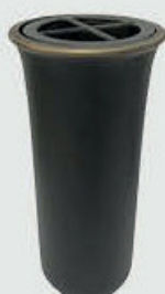
5213 QG - Brun matt patina Høyde 19 cm