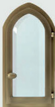
70748001 – Bronse Høyde 25 cm, bredde 12 cm