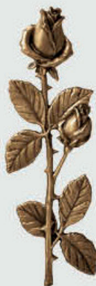
P 29 574 Høyde 27,5 cm, bredde 9 cm