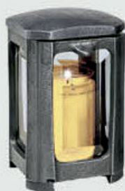
40 116 - Aluminium Høyde 17 cm