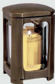
40 116 Høyde 17 cm