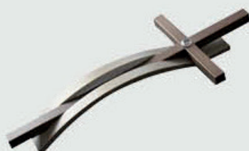
51 III s.1 Høyde 25 cm Bronse