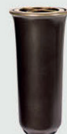
4163 VB Høyde 19 cm