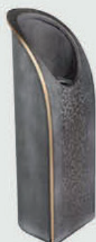
53 142 Høyde 30 cm