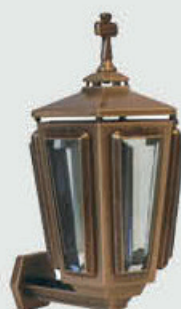
P 10 001

Høyde 21 cm, bredde 12 cm Fåes også i svart og hvitlakkert