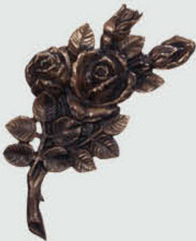
274 Høyde 23 cm, bredde 12 cm