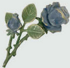
29351 – Blå Høyde 14 cm