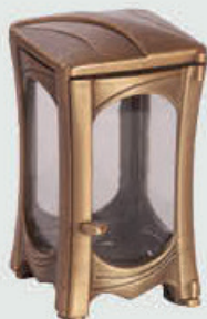
T 167.1 Høyde 17 cm, bredde 10 cm