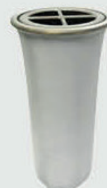
5214 QW - Hvit matt patina Høyde 19 cm