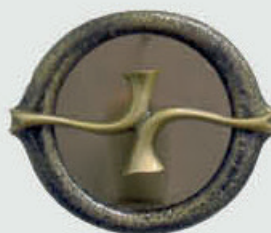
10 062 Diameter Ø 18 cm