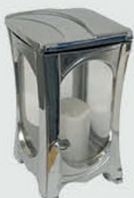
2702 / FN – Krom Høyde 17 cm, lys 2,5 døgn Fåes også i svart og hvitlakkert