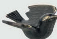
221 Bredde 9 cm