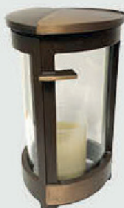
40381 Høyde 18 cm. Front-åpning