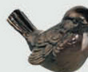
535 Bredde 11 cm