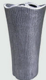
2800 - Aluminium Høyde 19 cm