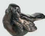
536 Bredde 11 cm