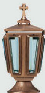
T 10 012

Høyde 21 cm, bredde 12 cm Fåes også i svart og hvitlakkert