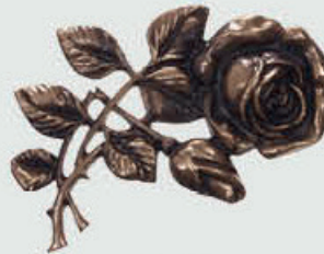
8 V Høyde 15 cm, bredde 10 cm