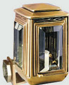
0405 Sidemontert 0705 Undermontert