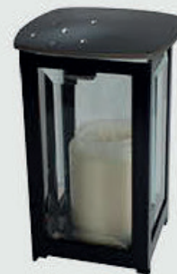
405 DM / S Med krystaller Høyde 19 cm