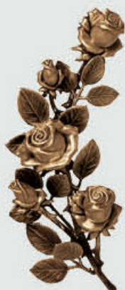
P 29 351 Høyde 27 cm, bredde 13 cm