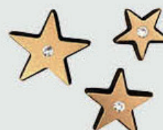
20968 Bronse 2 cm – 2,5 cm – 3 cm