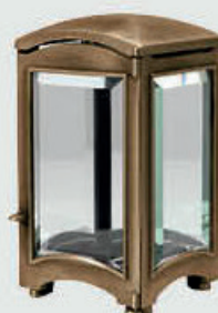
T 4056 M