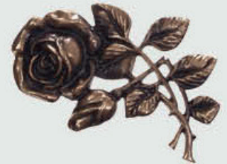
8 H Høyde 15 cm, bredde 10 cm