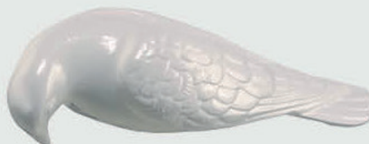
DUE 305 – 12 cm hvit brennlakkert DUE 307 – 14 cm hvit brennlakkert DUE 355 – 19 cm hvit brennlakkert