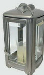
T 4497 – Alufarget bronse Høyde 20 cm, bredde 11 cm