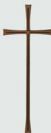
P 23 533 Høyde: 40 / *30 / 16 / 10 cm