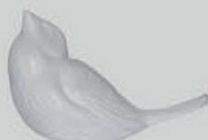
Hvit / Svart