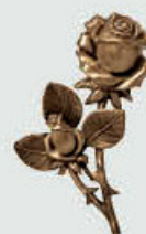
P 29 351 Høyde 14 cm, bredde 9 cm