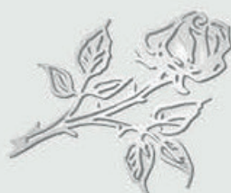
20 877 – Børstet stål Høyde 9 cm, bredde 7 cm