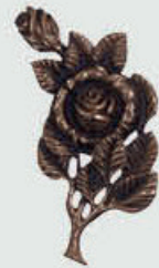
12 H Høyde 16 cm, bredde 7,5 cm