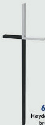
62 588 Høyde 30 cm Mørk bronse / stål