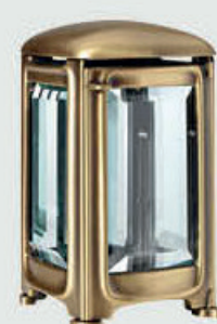
T 4468 M