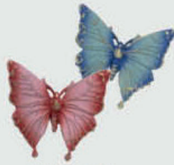
7619 Blå Høyde 4 cm, bredde 5,5 cm