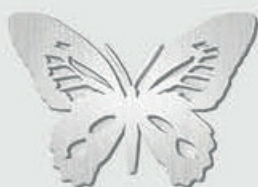
20 864 – Børstet stål Høyde 9 cm, bredde 7 cm