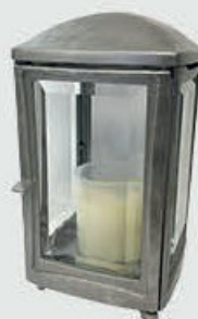
4703 – Alufarget bronse Høyde 19 cm