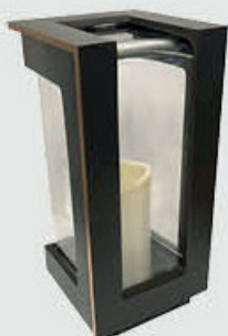
40246 Høyde 25 cm. Vippe-åpning