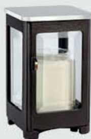
40 265 Mørk bronse m/ståltopp Høyde 16 cm