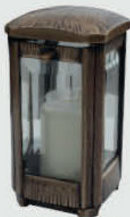
LB 105 N Høyde 19 cm