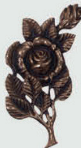
11 V Høyde 20 cm, bredde 10 cm