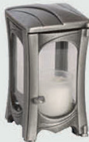
T 167.2 – Aluminium Høyde 17 cm, bredde 10 cm