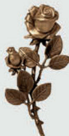
P 29 351 Høyde 18 cm, bredde 10 cm