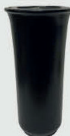
T 4163 – Svart Høyde 19 cm, bredde 10 cm