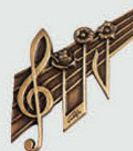
P 31 082 Høyde 6 cm, bredde 8,5 cm