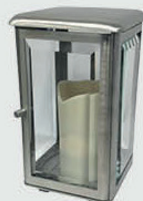
1919.6 – Børstet stål Høyde 21 cm