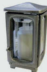
1621 F - Aluminium Høyde 19 cm