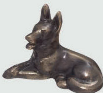
99 021 – Helfigur Høyde 6,5 cm, bredde 5,5 cm, lengde 10 cm