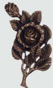
11 H Høyde 20 cm, bredde 10 cm