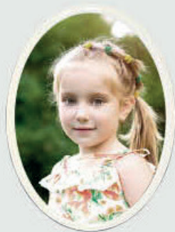
PORSELENSBILDE Oval, hvit kant Høyde 12 cm, bredde 9 cm