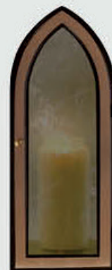
10 067 Høyde 33 cm, bredde 14 cm