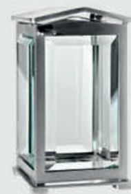
T 0119 SAT – Børstet stål Høyde 18 cm, bredde 10 cm