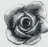
470402 – Alufarget Ø 4 cm