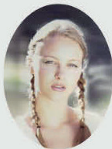
PORSELENSBILDE Oval Høyde 12 cm, bredde 9 cm