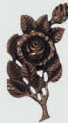
12 V Høyde 16 cm, bredde 7,5 cm