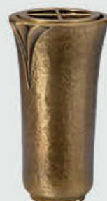
T 4341 Høyde 19 cm, bredde 10 cm