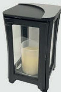
455204 NSI Høyde 16,5 cm Svart matt bronse med grått felt