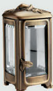
T 4497 M Høyde 20 cm, bredde 11 cm