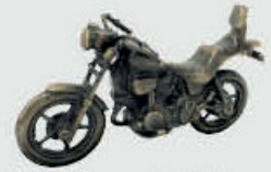
973 Motorsykel – Bronse 16 x 9 x 5,5 cm