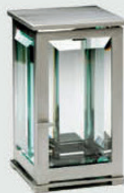
T 0134 SAT 1 – Børstet stål Høyde 18 cm, bredde 11 cm