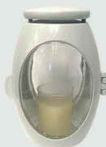
T 10316 – Hvit