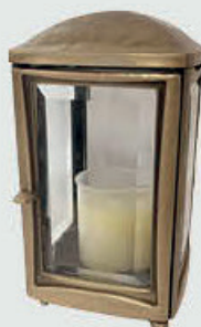
4703 B Høyde 19 cm