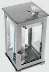
T 0134 SAT 4 – Børstet stål Høyde 18 cm, bredde 11 cm