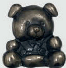
99 171 – Relief / helfigur Høyde 9,5 cm, bredde 10 cm, lengde 4 cm