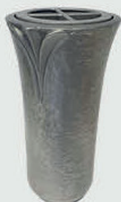
T 4341 – Alufarget bronse Høyde 19 cm, bredde 10 cm