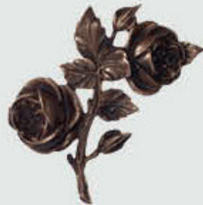
389 Høyde 16 cm, bredde 11 cm