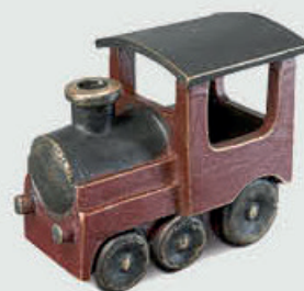
85 291 – Helfigur Høyde 8 cm, bredde 5 cm, lengde 10 cm