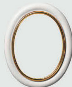
P 19 534 Høyde 15 cm, bredde 11 cm Høyde 12 cm, bredde 9 cm