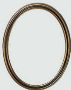
P 19 377 – Gull / hvit / sort Oval / Rektangulær Høyde 15 cm, bredde 11 cm Høyde 12 cm, bredde 9 cm Høyde 10 cm, bredde 8 cm Høyde 9 cm, bredde 7 cm