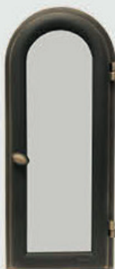
702 914 QG – Brun matt patina Høyde 32 cm, bredde 14 cm