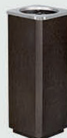
53 208 Med ståltopp Høyde 19 cm