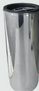
490 223 – Polert stål Høyde 24 cm