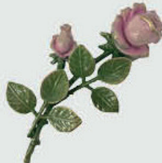
29351 – Rosa Høyde 14 cm