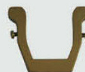
P 90 902

Høyde 21 cm, bredde 12 cm Fåes også i svart og hvitlakkert