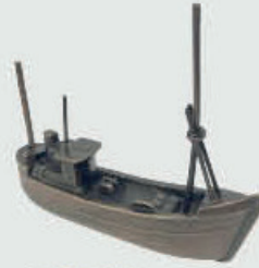
990 Båt – Bronse 11,5 x 10,5 x 3 cm