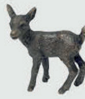
948 Hjortedyr – Bronse 5 x 4,5 x 2 cm