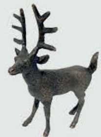
946 Hjortedyr – Bronse 12 x 9 x 5 cm

Reinsdyr, Elg, båt og motorsykel er resultat av 3D-scanning. Originalen vil bli sendt i retur sammen med bronsedekoren. Siden dette er skreddersøm vil pris avtales.