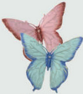
7618 Blå Høyde 7,5 cm, bredde 8 cm