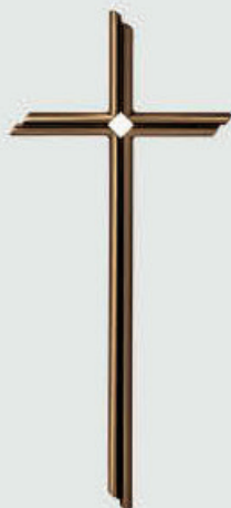
P 24 215 Høyde: 40 / *30 cm