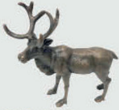
992 Reinsdyr – Bronse 12 x 12 x 5 cm