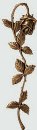
* P 29 552 Høyde 29,5 cm, bredde 8 cm