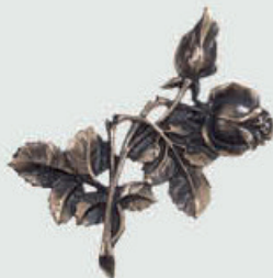
390 V Høyde 11 cm, bredde 17 cm