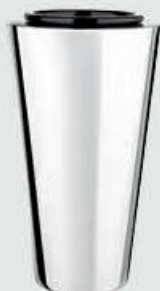
T 60 740 – Polert stål Høyde 20 cm, bredde 11 cm